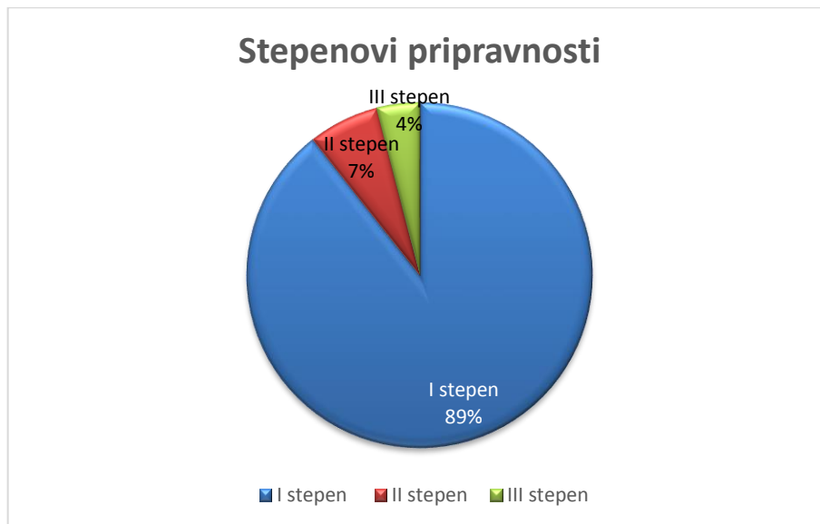
Slika 9. Stepenovi pripravnosti